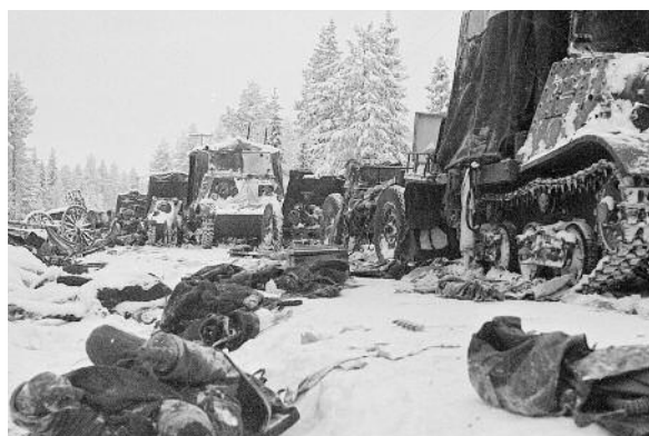
Νεκροί σοβιετικοί στρατιώτες με τον εξοπλισμό τους στο δρόμο του Ραάτε κοντά στο χωριό Σουμουσάλμι, αφού περικυκλώθηκαν και νικήθηκαν στη μάχη του δρόμου του Ραάτε τον Ιανουάριο του 1940 από λιγότερα αριθμητικά φινλανδικά στρατεύματα.

Στη ρωσοφινλανδική σύγκρουση έλαβε μέρος και ένα μικρό σώμα Ουκρανών εθελοντών. Επικεφαλής του ουκρανικού εθελοντικού σώματος ήταν ο πρώην