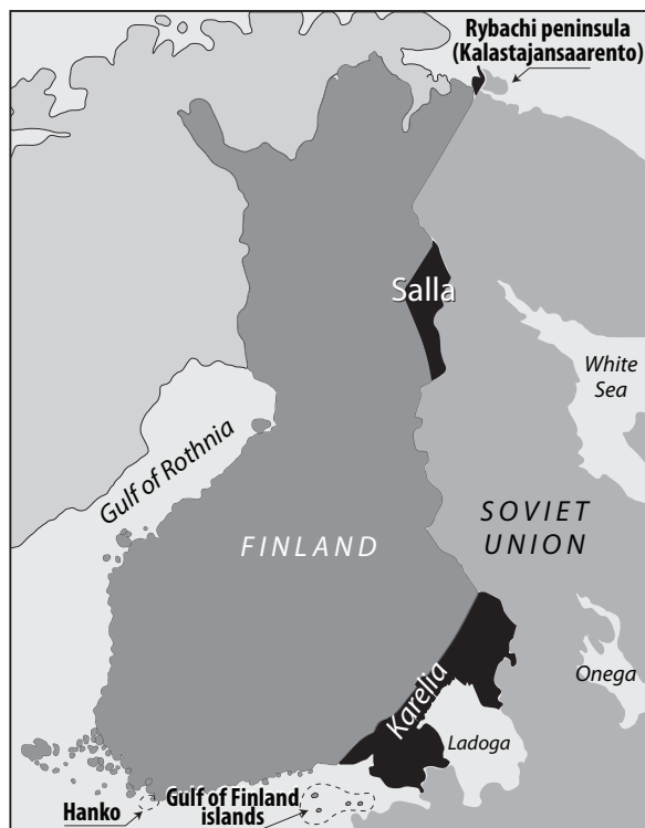
Οι εδαφικές παραχωρήσεις της Φινλανδίας στη Σοβιετική Ένωση μετά το τέλος του Χειμερινού Πολέμου σημειώνονται στο χάρτη με μαύρο χρώμα.