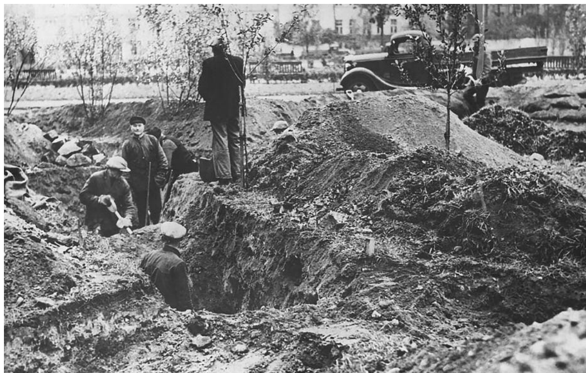
Χαρακώματα που σκάφθηκαν στο Ελσίνκι την 1η Δεκεμβρίου του 1939.