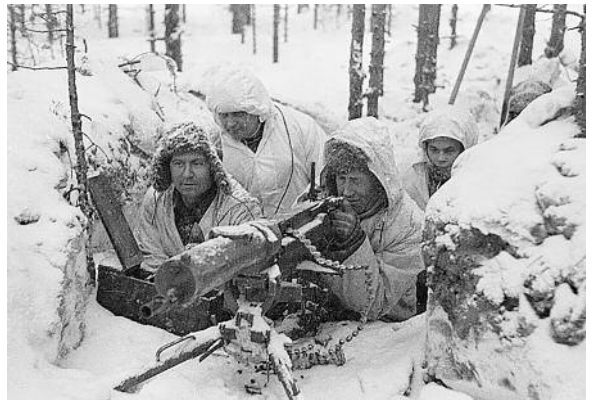
Ομάδα Φινλανδών στρατιωτών με χειμερινή στολή καμουφλάζ σε δράση με ένα πολυβόλο M32, το οποίο βασίστηκε στο ρωσικό πολυβόλο PM M1910, ωστόσο τροποποιήθηκε από το Φινλανδό σχεδιαστή όπλων Άιμι Λάχι (Aimo Lahti) το 1932, προκειμένου να χρησιμοποιηθεί αποτελεσματικά σε χειμερινές επιχειρήσεις.

Η σοβιετοφινλανδική σύγκρουση τελείωσε στις 12 Μαρτίου του 1940 με τη Συνθήκη ειρήνης της Μόσχας, στην οποία δεν αναφερόταν καθόλου η Λαϊκή Δημοκρατία της Φινλανδίας. Βάσει της παραπάνω συνθήκης, η Φινλανδία εκχωρούσε στη Σοβιετική Ένωση τον Ισθμό της Καρελίας, το φινλανδικό μέρος της χερσονήσου του Rybachί στη Θάλασσα Barents στον Αρκτικό Ωκεανό, τα νησιά του κόλπου της Φινλανδίας (Suursaari, Tytärsaari, Lavansaari, Repinsaari και Seiskari), μια μεγάλη έκταση εδαφών κατά μήκος της λίμνης Λάντογκα και στα βόρεια της χώρας. Η χερσόνησος του Χάνκο μισθώθηκε στη Σοβιετική Ένωση ως ναυτική βάση για 30 χρόνια με ετήσιο ενοίκιο 8 εκατομμυρίων μάρκων. Τα σοβιετοφινλανδικά σύνορα μεταφέρθηκαν από το Λένινγκραντ 120 χιλιόμετρα στο έδαφος του Ισθμού της Καρελίας. Η Φινλανδία προέβη σε παραχωρήσεις που ήταν πιο επαχθείς σε σχέση με τις σοβιετικές απαιτήσεις πριν τον πόλεμο (Τούντα-Φεργάδη Αρετή, 2007, σσ. 34-36). Η Φινλανδία απώλεσε το 11% των εδαφών της, το οποίο αντιπροσώπευε το 30% της οικονομίας της. Επίσης, 430.000 Φινλανδοί από τα κατεχόμενα εδάφη αναγκάστηκαν να εγκαταλείψουν τις εστίες τους και να μετακινηθούν στην υπόλοιπη χώρα. Ωστόσο, η Φινλανδία δε μετατράπηκε σε σοβιετική δημοκρατία. Αντίθετα, διατήρησε την κυ-