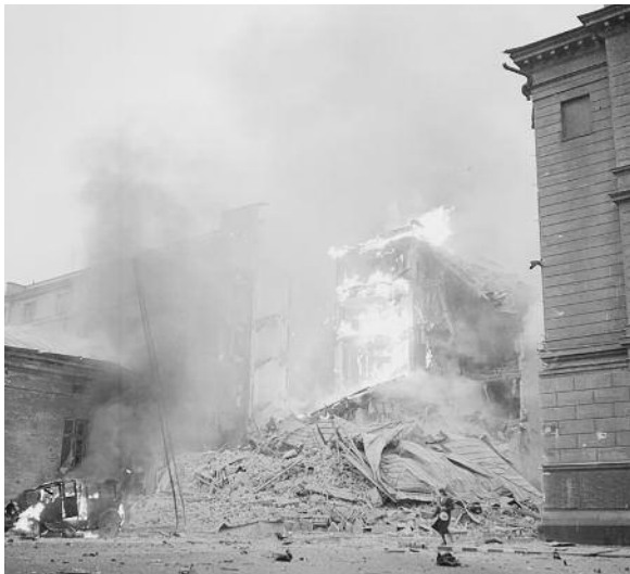
Πυρκαγιά στο Ελσίνκι μετά από σοβιετικές εναέριες βομβιστικές επιθέσεις στις 30 Νοεμβρίου 1939.

του Προέδρου Μπόρις Γέλτσιν παραδέχτηκε ότι ο πόλεμος εναντίον της Φινλανδίας ήταν επιθετικός. Το 2013 ο Ρώσος πρόεδρος Βλαντιμίρ Πούτιν δήλωσε σε συνάντηση με στρατιωτικούς ιστορικούς ότι η Ε.Σ.Σ.Δ. ξεκίνησε τον Χειμερινό πόλεμο για να «διορθώσει τα λάθη» που έγιναν στον καθορισμό των συνόρων με τη Φινλανδία μετά το 1917 ( https://yle.fi/uutiset/osasto/news/putin_winter_war_aimed_at_correcting_border_mistakes/6539940 ).