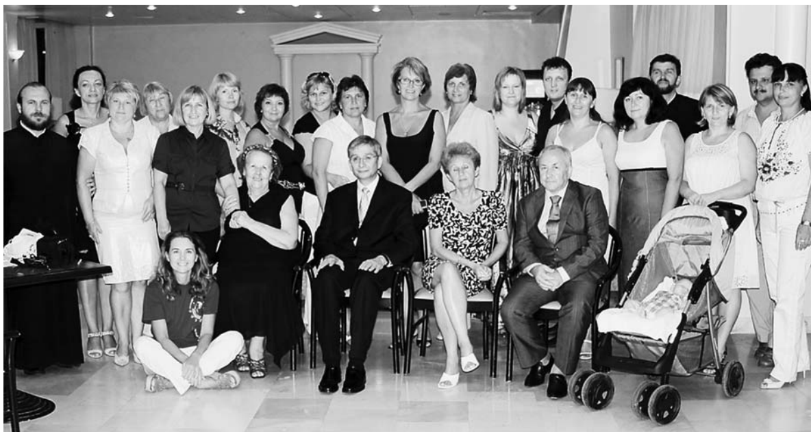
IV Форум української діаспори в Греції. Еретрія. 2010 рік.