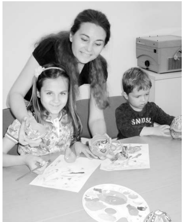
Великодні писанки своїми руками під керівництвом художниці.