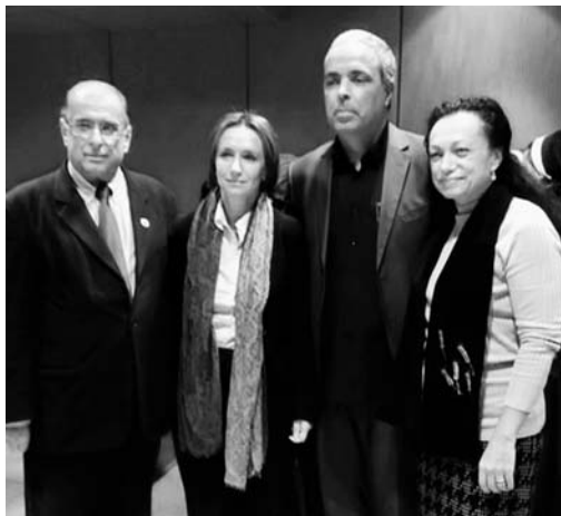
Відзначення річниці Голодомору. Листопад 2017, Афіни.