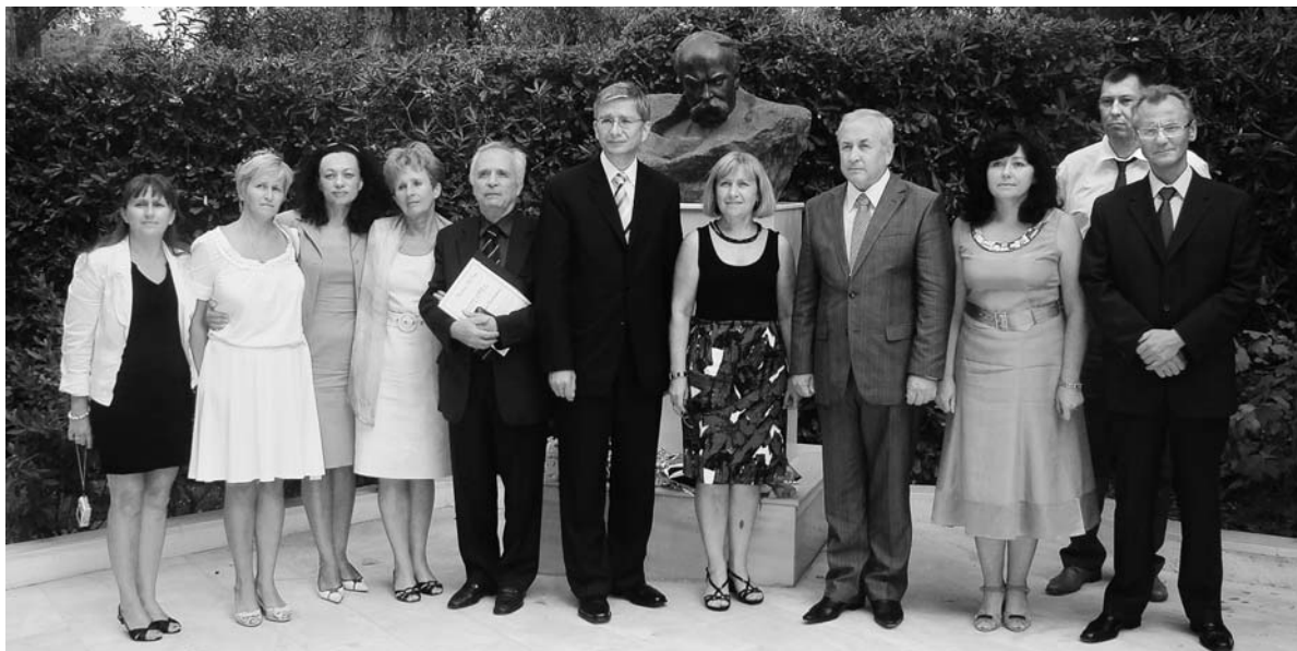
Εκπροσώπηση του Παγκόσμιου Κογκρέσου Ουκρανών στην Πρεσβεία της Ουκρανίας. 2010, Αθήνα.