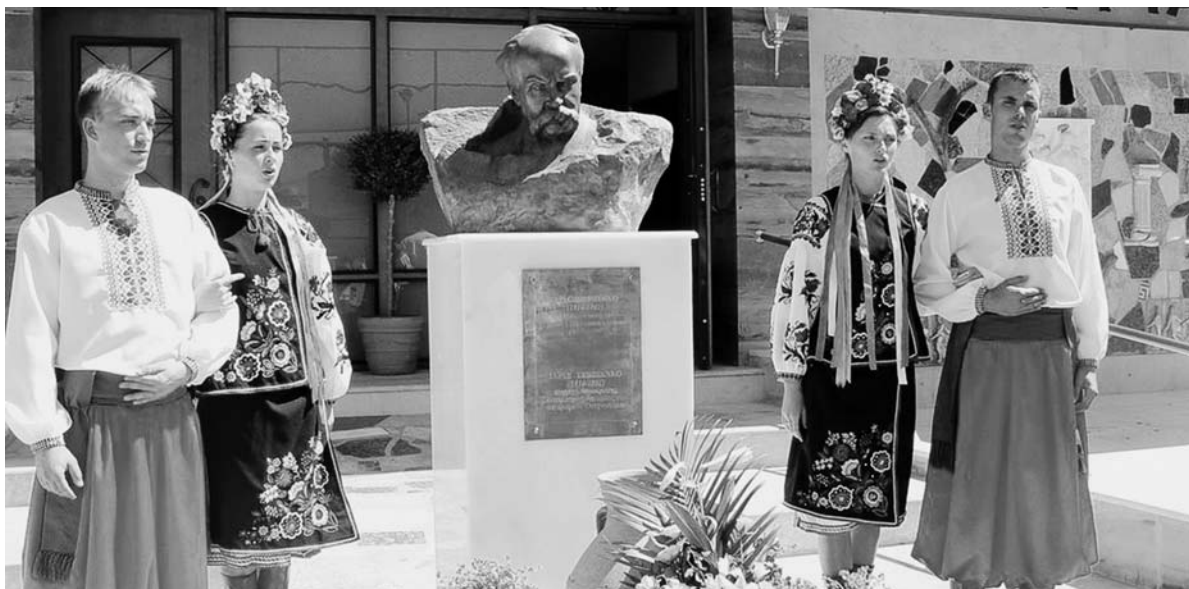
II Φόρουμ της ουκρ. διασποράς στην Ελλάδα. 2008, Αθήνα.