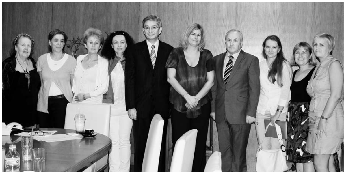
IV Φόρουμ της ουκρ. διασποράς στην Ελλάδα. Εκπροσώπηση του Παγκόσμιου Κογκρέσου Ουκρανών στο Δήμο Αθηναίων, 2010.