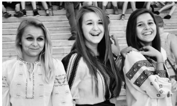
Γιορτή της βισιβάνκα στην Αθήνα, 2013/2014