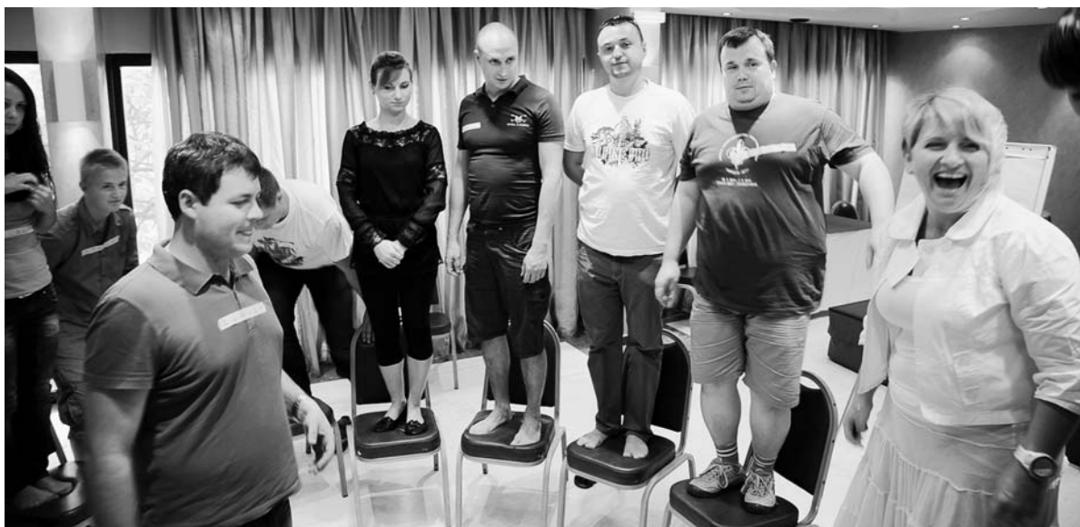
Πρόγραμμα "Νεολαία σε δράση". Οκτώβριος 2012.