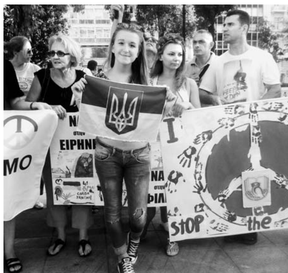
21.09.2014 – οι Ουκρανοί της Ελλάδας στη Διεθνή Ημέρα Ειρήνης.