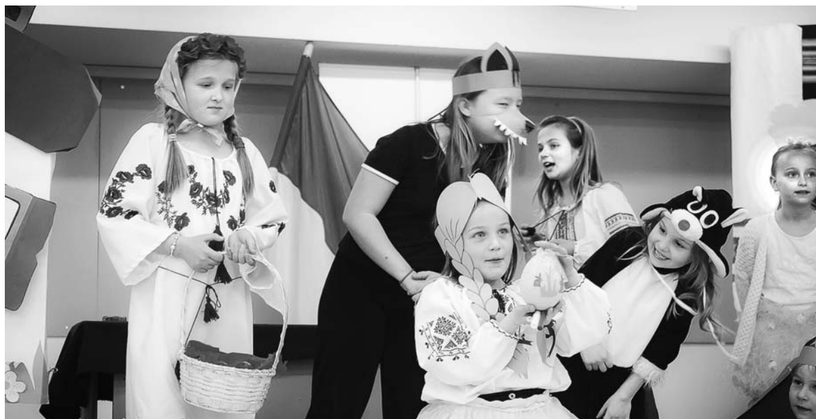
Πασχαλινή εκδήλωση του σχολείου, Απρίλιος 2014.