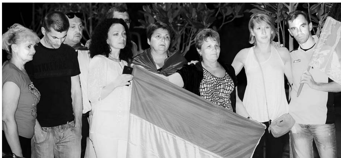
Υπεράσπιση της Πρεσβείας της Ουκρανίας στην Ελλάδα, Σεπτέμβριος 2014, Αθήνα.