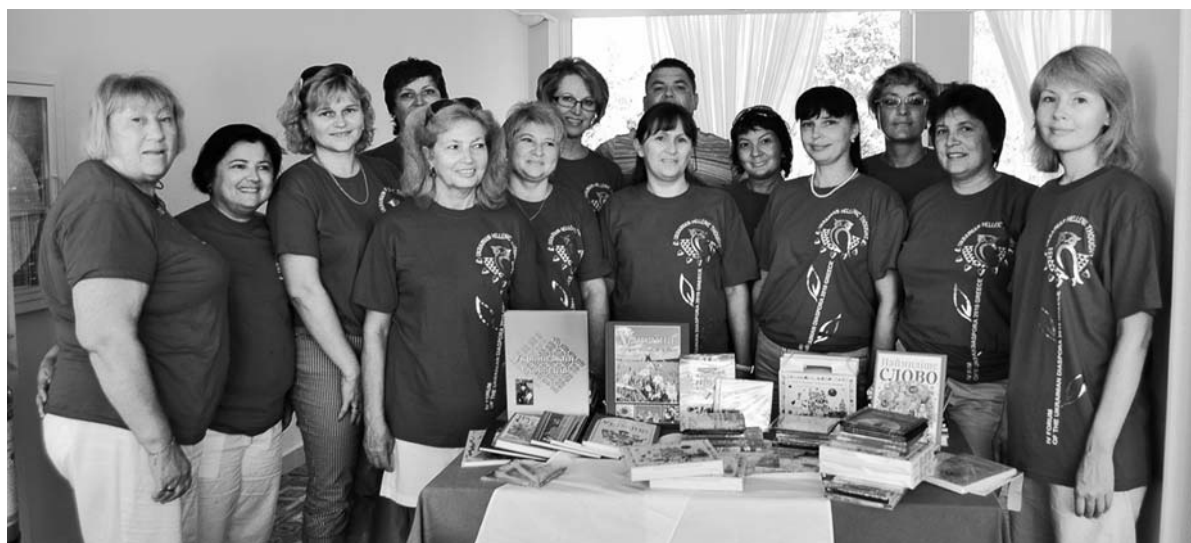
IV Φόρουμ της ουκρ. διασποράς στην Ελλάδα. Ημερίδα παιδαγωγών, 2010, Ερέτρια, Εύβοια.