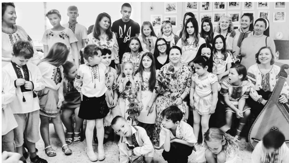
Η λαϊκή τραγουδίστρια Νίνα Ματβιγιένκο στο σχολείο, Μάιος 2017, Αθήνα.