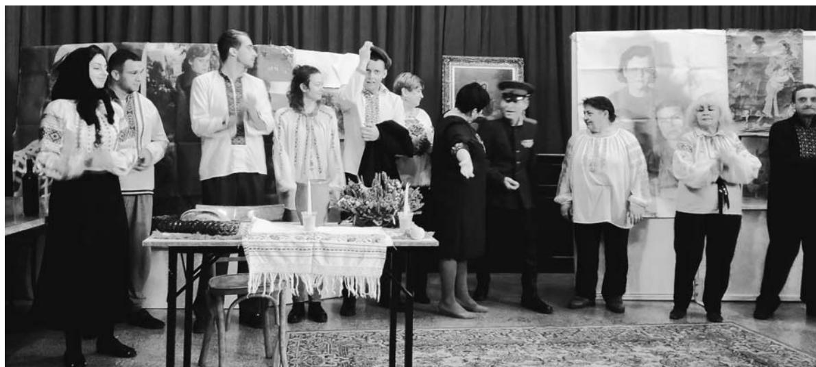
Το "Χριστιανικό θέατρο" του Λβιβ στην Αθήνα. Νοέμβριος 2017.