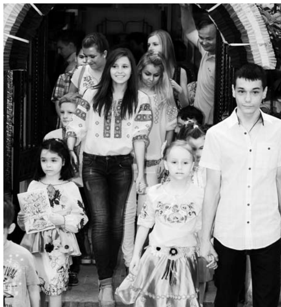
Εναρξη της σχολικής χρονιάς, Σεπτέμβριος 2013, Αθήνα.