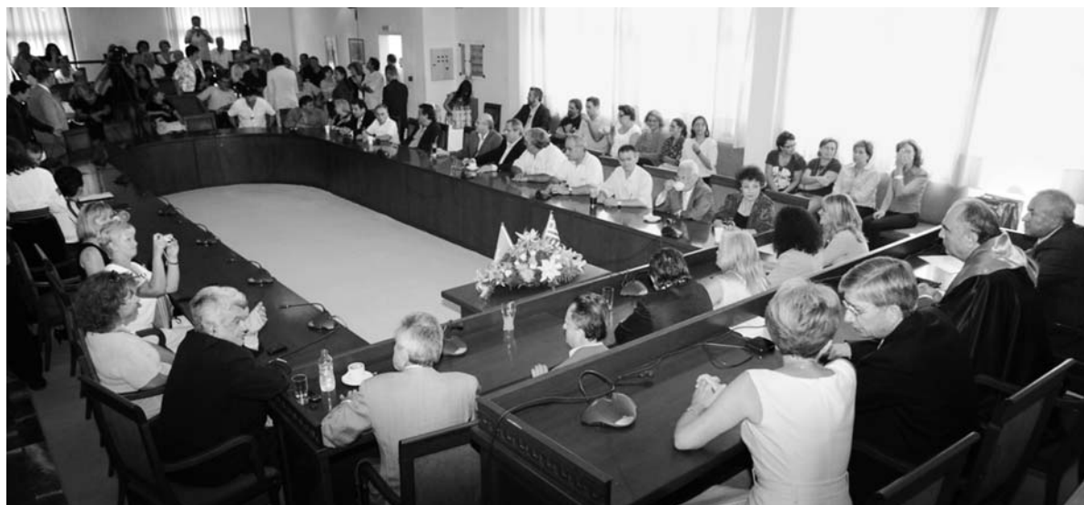
IV Φόρουμ της ουκρ. διασποράς στην Ελλάδα. Εκπροσώπηση του Παγκόσμιου Κογκρέσου Ουκρανών στο Δήμο Ζωγράφου, 2010.