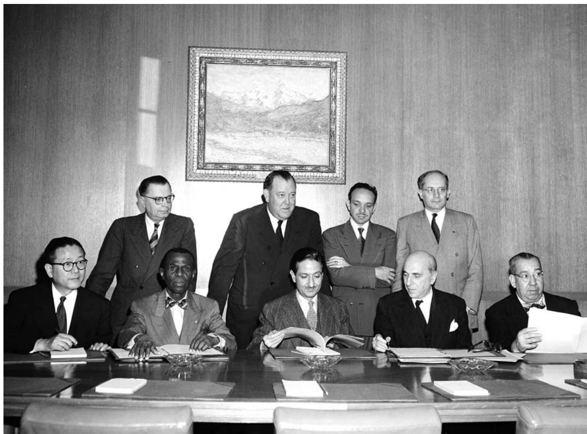
РАТИФІКАЦІЯ КОНВЕНЦІЇ ПРО ЗАПОБІГАННЯ ТА ПОКАРАННЯ ЗЛОЧИНУ ГЕНОЦИДУ На фото представники чотирьох країн, які ратифікували Конвенцію 14 жовтня 1950 р.

Сидять (зліва направо): д-р Джон П. Чанг, Корея; д-р Жан Пріс-Марс (Гаїті); Голова Генеральної Асамблеї ООН Посол Насроллаг Ентезам (Іран); Посол Жан Шовель (Франція) і Рубен Есківель де ла Гвардія (Коста-Ріка). Стоять (зліва направо): д-р Іван Керно, помічник Генерального секретаря з юридичних питань; Трігве Лі, Генеральний секретар ООН; Мануель А. Фурньє Акука, Коста Ріка; д-р Р. Лемкін.