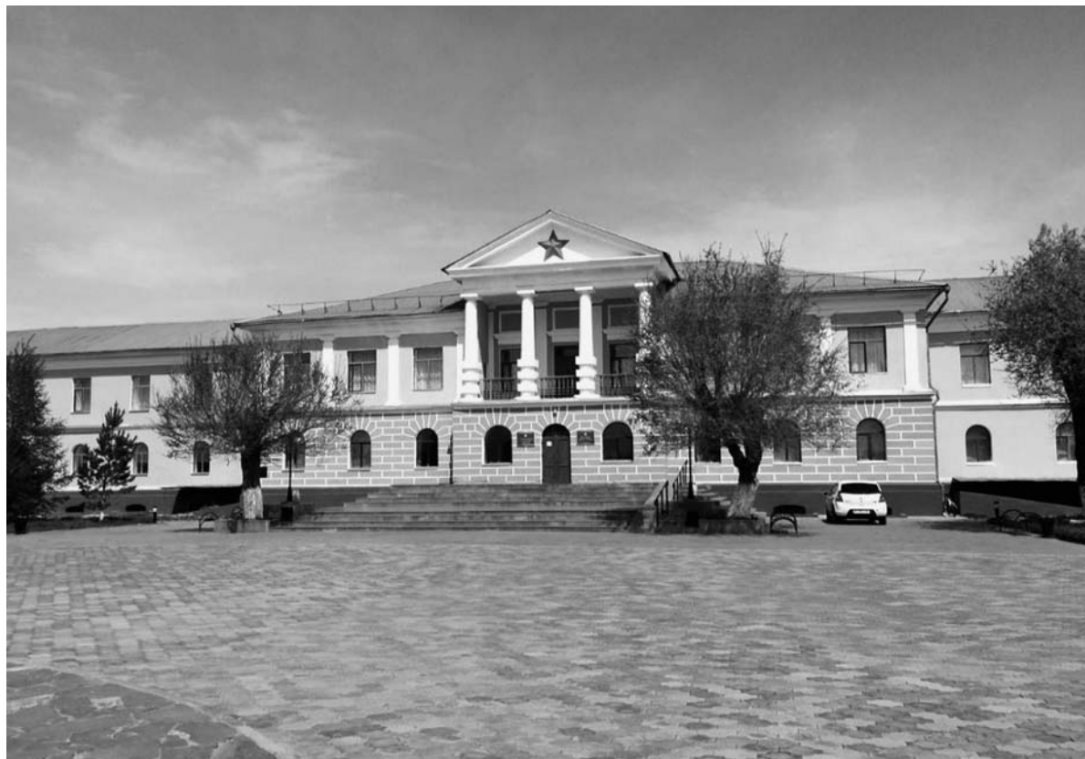
Музей жертвам політичних репресій. с. Долинка, Казахстан