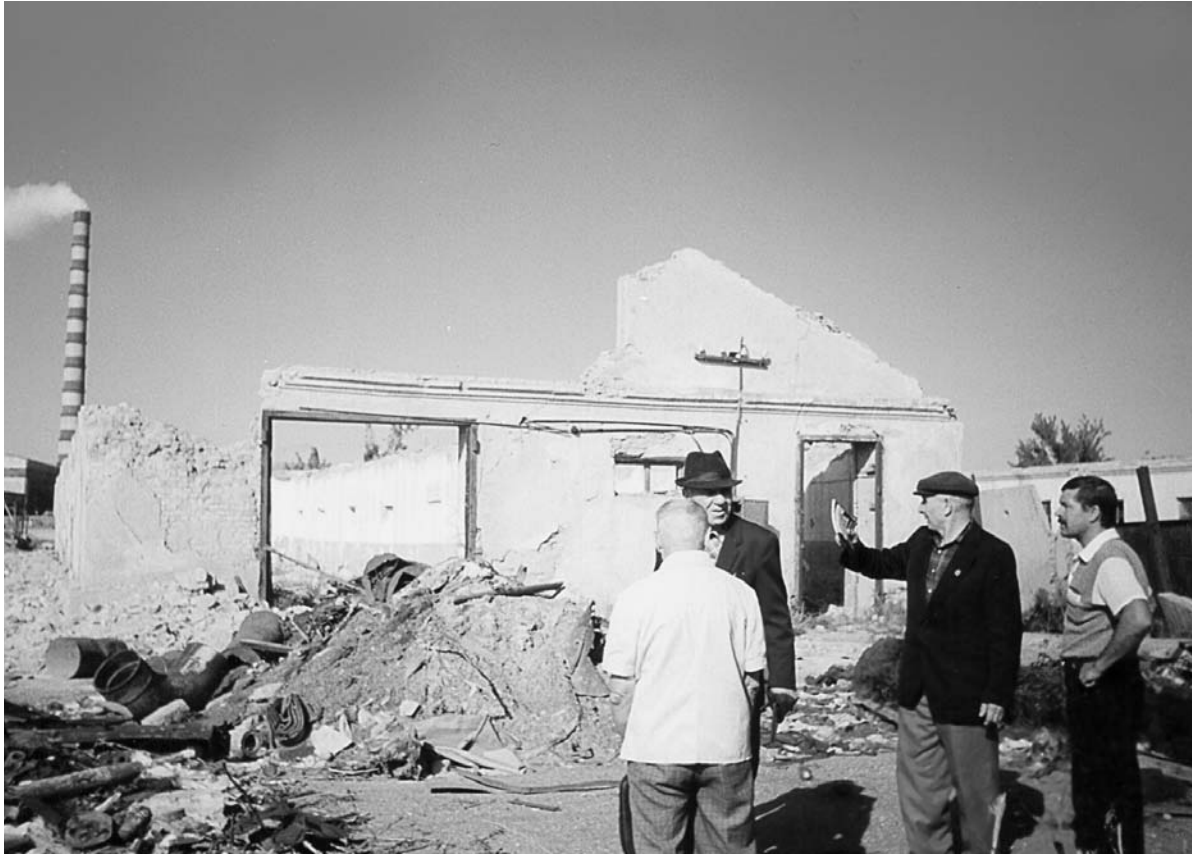
Залишки Степового табору (Степлагу) в табірному відділенні Кенгір під Джезказганом (Казахстан), де українці склали 46% від загального числа в'язнів

– Не можу втриматися і не запитати, що Вам допомагає триматися та мати таку кількість енергії, якій позаздрять 20-річні юнаки.